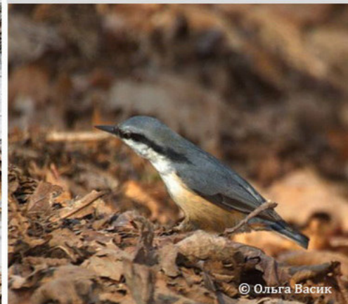
Обыкновенный поползень - Sitta europaea