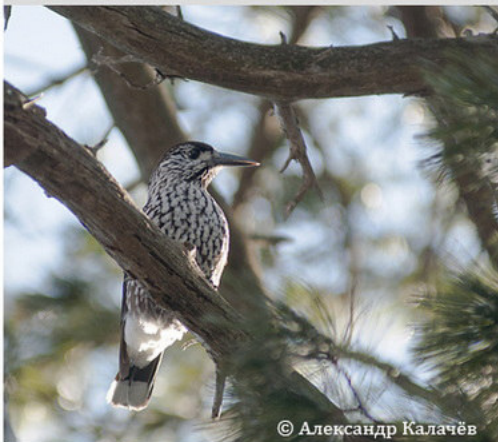
Кедровка - Nucifraga caryocatactes