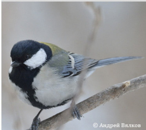
Восточная синица - Parus minor