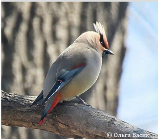
Амурский свиристель - Vombocilla japonica