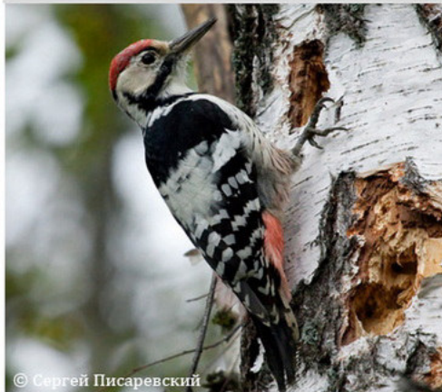
Белоспичный дятел - Dendrocopos leucotos