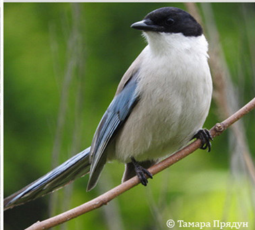
Голубая сорока - Cyanopica cyanus