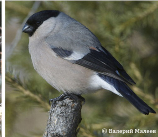
Серый снегирь - Pyrhula cineracea