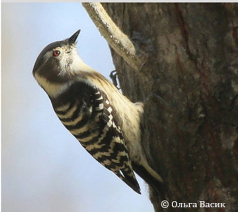
Малый острокрылый дятел - Dendrocopos kizuki