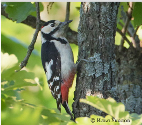
Большой пёстрый дятел - Dendrocopos major