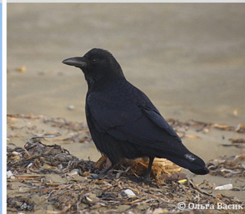
Чёрная ворона - Corvus corone