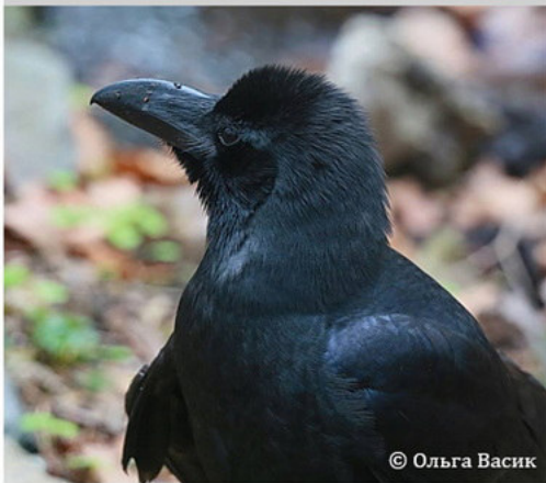
Большеклювая ворона - Corvus macrorhynchus