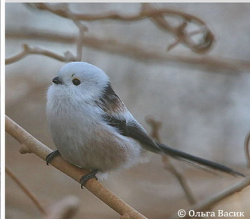
Длиннохвостая синица - Legithalos caudatus