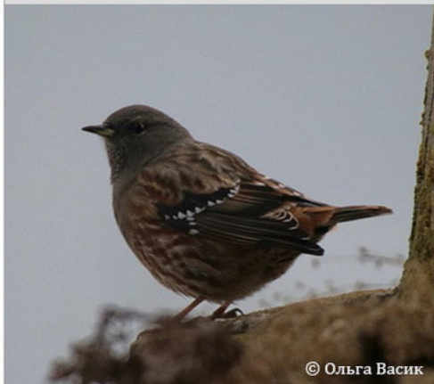
Альпийская завирушка - prunella collaris