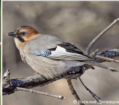
Сойка - Garrulus glandarius