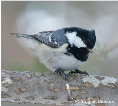
Московка - Parus ater