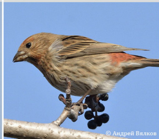
Сибирская чечевица - Carpodacus roseus