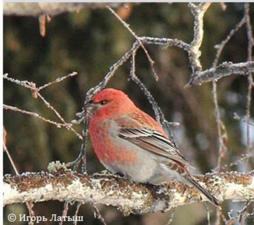
Шур - Pinicola enucleator