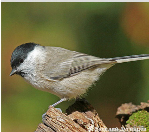
Черноголовая гаичка - Parus palustris