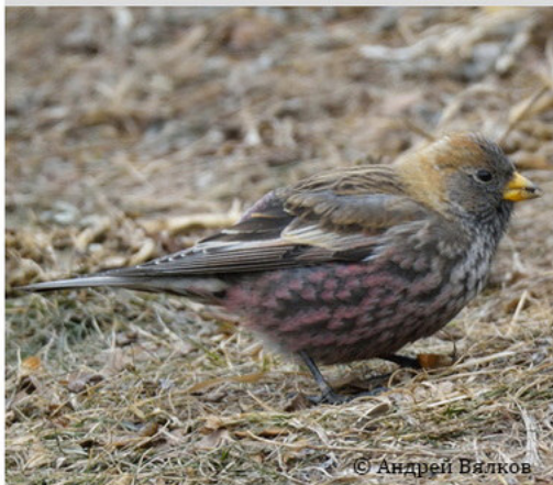
Сибирский вьюрок - Leucosticte arctoa