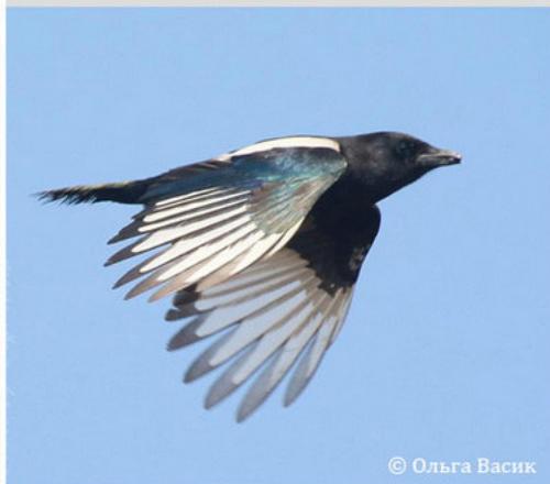
Сорока - Pica pica