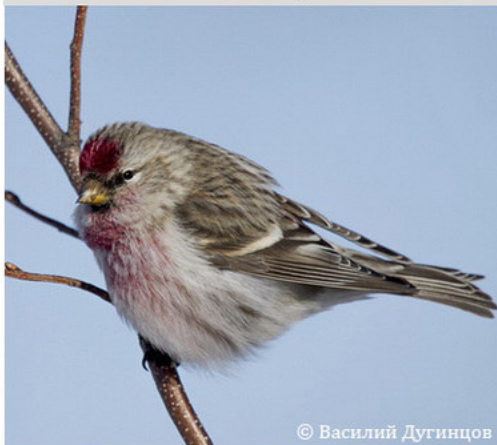
Чечётка - Acanthis flammea